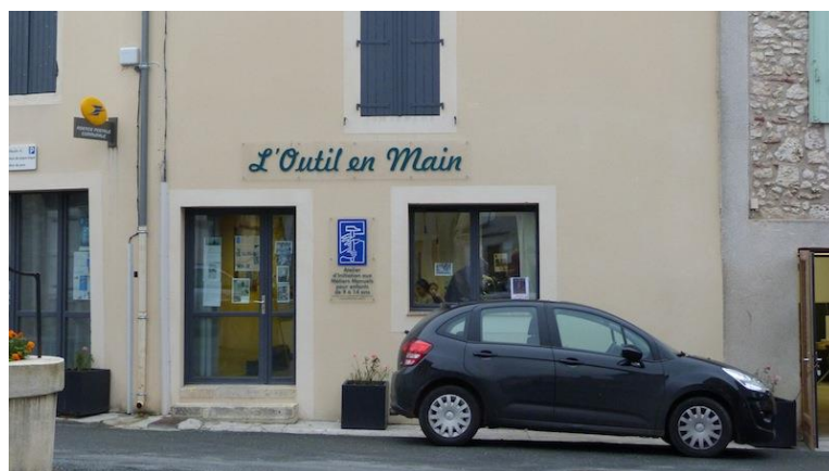
Localisation de l'Outil en Main à Montpezat

Aujourd'hui, l'association fonctionne bien et de plus en plus d'enfants souhaitent participer aux ateliers du mercredi après-midi. Cependant, cette dernière ne dispose pas du matériel et de la place suffisante pour satisfaire à ces demandes.