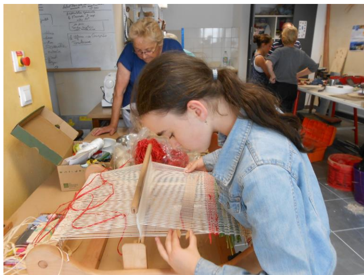
Ateliers du mercredi

Jusqu'en 2013, les ateliers se déroulaient dans une salle servant à d'autres associations. Les outils et les installations appartenant aux Gens de métier, étaient démontés et emportés à la fin de chaque séance.